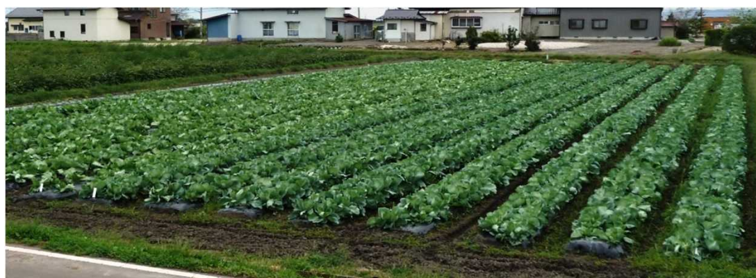
上：促成アスパラガス根株養成実証圃場